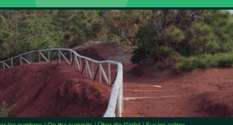
Por las cumbres / On the summits / Über die Gipfel / Sur les arêtes