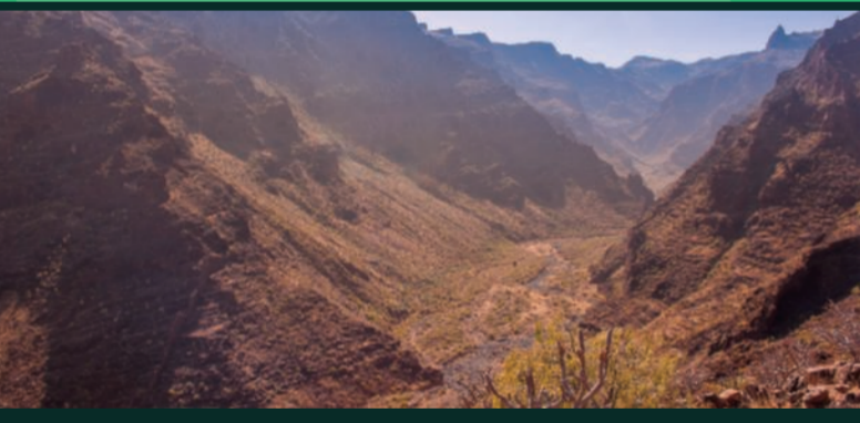
Por los barrancos / In the ravines / Durch die Schluchten / Dans les canyons