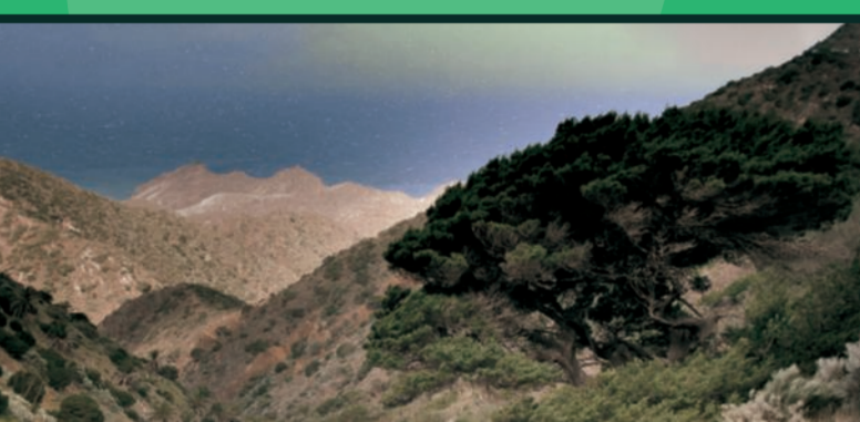
Por las lomas / On the slopes / Über die Berg Rücken / Sur les flancs de collines